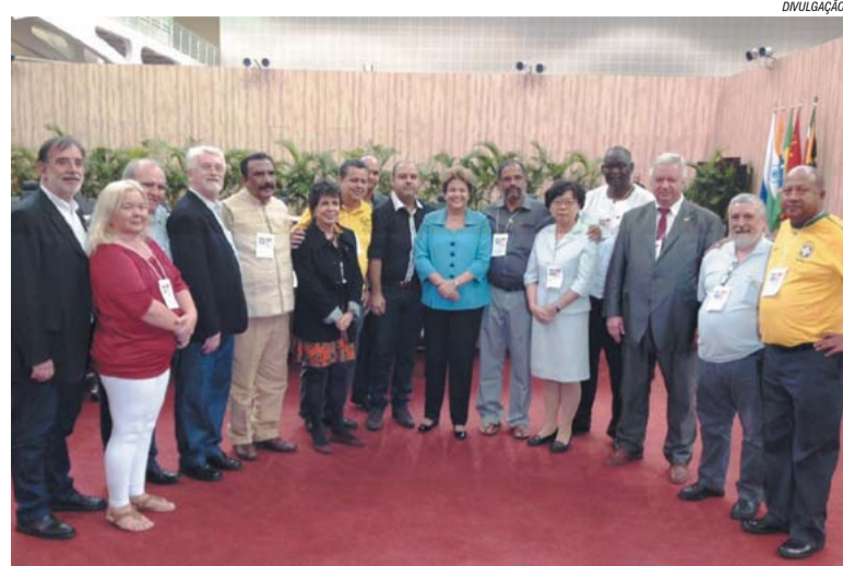
Dilma ao centro com o presidente da CUT, Vagner Freitas, e outros membros dos BRICS Sindical

O encontro foi simultâneo aos chefes de Estado e Governo dos BRICS – formado por Brasil, Rússia, Índia, China e África do Sul.