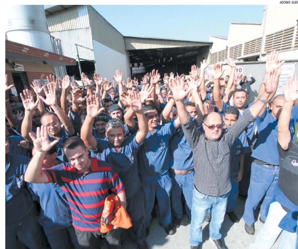
Trabalhadores em assembleia na Metaltork